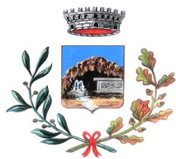
Comune di Romana