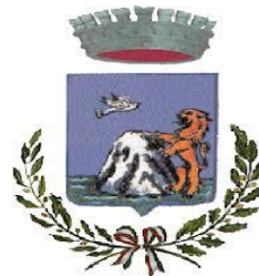
Comune di Monteleone Rocca Doria